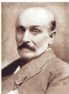
Вилијам Рандал Кремер (1828 - 1908)

Дакле, у оваквим околностима и захваљујући ентузијазму посланика Пасија и Кремера, на конференцији 29. јуна 1889. године у париском хотелу „Континентал”, створена је Интерпарламентарна унија , уз учешће 95 посланика из Француске, Велике Британије, Италије, Белгије, Шпаније, Мађарске, Данске, САД и Либерције, чиме је обезбеђен међународни основ конференције и њен правно-политички карактер у складу са међународним правом. Интерпарламентарна унија је на овој конференцији званично названа „Парламентарна арбитражна конференција”.