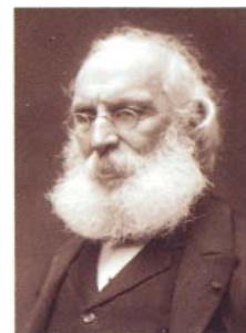
Фредерик Паси (1822 - 1912)

У знак признања за допринос миру, оснивачи Интерпарламентарне уније Фредерик Паси (1901) и Вилијам Рандал Кремер (1903) добили су Нобелову награду.