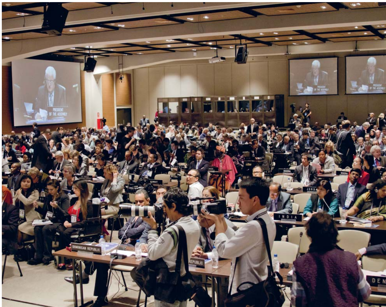
128. Заседање ИПУ, Еквадор, 2013. године

њених радних тела. Генерални секретар Народне скупштине учествује у раду Асоцијације генералних секретара Уније. Своје учешће Народна скупштина остварује преко сталне делегације регистроване у Унији.