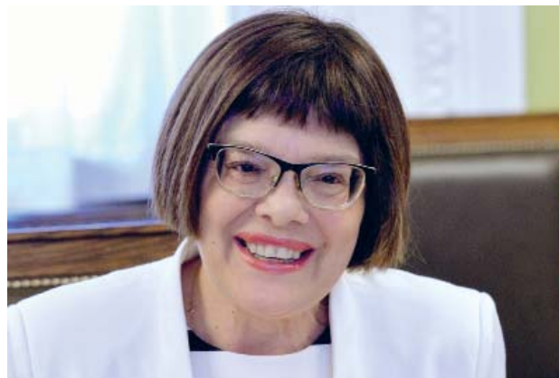
председник Народне скупштине, Маја Гојковић

Република Србија је по свом уставноправном устројству парламентарна демократија с поделом власти, при чему законодавна власт и улога Парламента имају водећу улогу. Народна скупштина је основ и гарант демократског и правног устројства и функционисања државе. Наша земља је у претприступним преговорима с Европском унијом како би остварила пуноправно чланство у њој. То подразумева изградњу демократских институција, правне државе и политичког система базираног на владавини права и поштовању људских права. Евроинтегративни процеси подразумевају прихватање, уградњу и примену правних тековина Европске уније, што је квантитативно и квалитативно оствариво само у условима достигнутих стандарда демократског друштва, владавине права и демократских институција. Све ово представља стратешки циљ Републике Србије за наредни период.