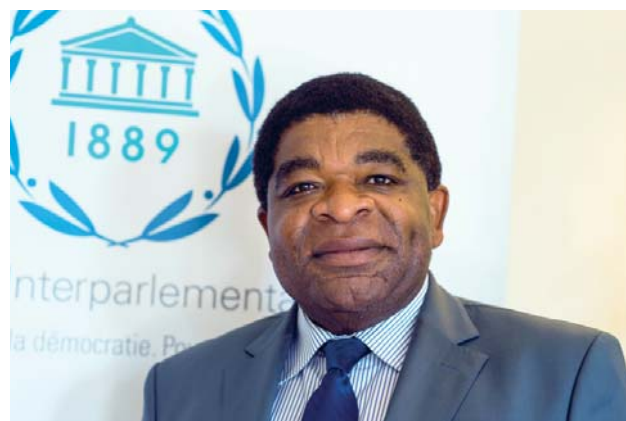
Генерални секретар Интерпарламентарне уније, Мартин Чунгонг