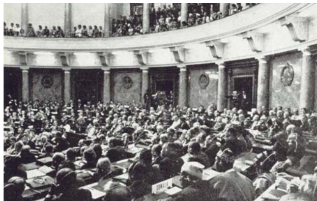
52. конференција ИПУ у Београду

Оваквим приступом и политичким ставом Интерпарламентарна унија је потврдила основно опредељење за