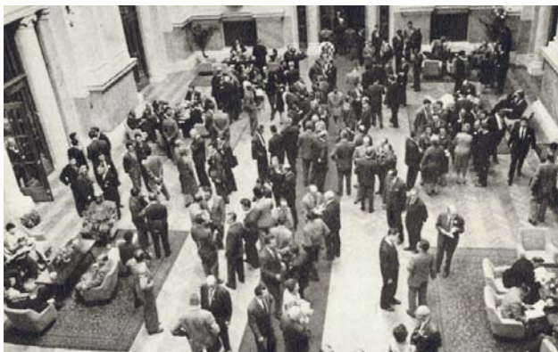
52. Конференција ИПУ у Београду, Централни хол

Поводом таквог међународног утицаја Југославија је 1963. године добила домаћинство редовне 52.