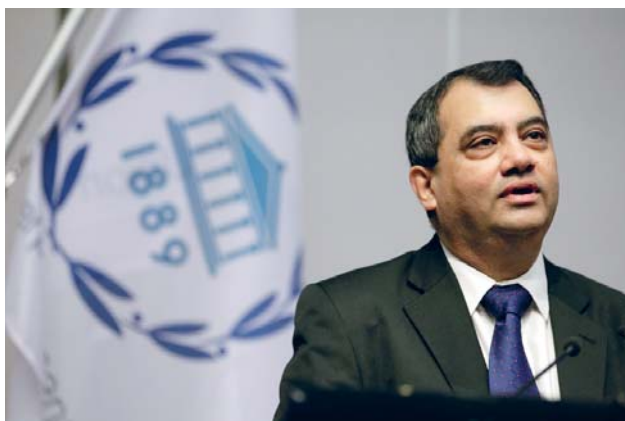
Председник Интерпарламентарне уније, Сабер Чаудри