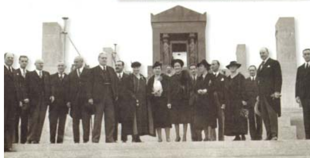
Председништво Интерпарламентарне уније на Авали, октобар 1938 (БМС)