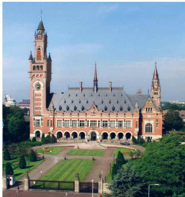
Међународни суд правде у Хагу

„У свакој држави власт једино може бити изведена из воље народа истински изражене на слободним и поштемим изборима одржаним у регуларним интервалима на основу универзалних, равноправних и тајних гласања.“