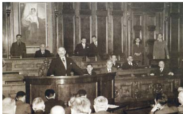
Гроф Картон де Виар, председник Интерпарламентарне уније, говори у Народној скупштини, Београд, 1. октобар 1938 (БМС)